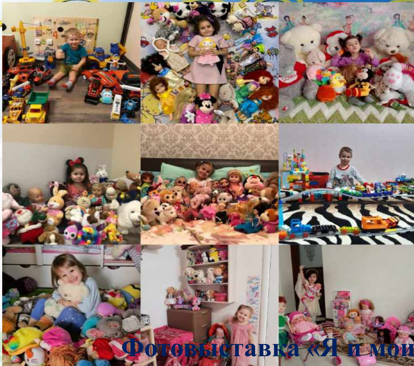
Фотовыставка «Я и мои игрушки дома»