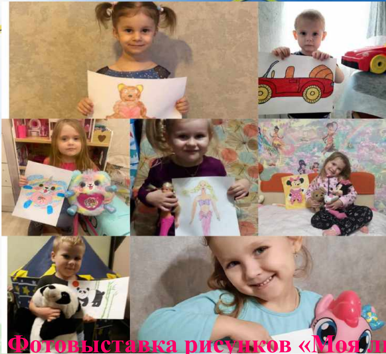
Фотовыставка рисунков «Моя любимая игрушка»